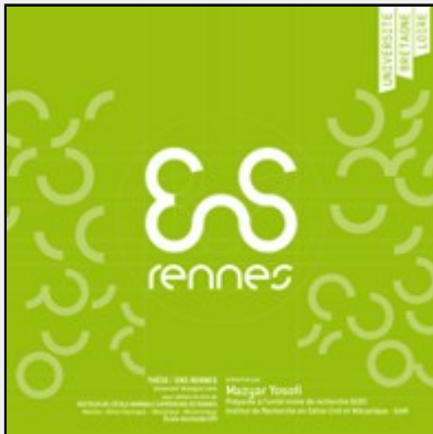
Méthodologie de caractérisation prédictive des procédés de fabrication additive avec une approche technique, économique et environnementale