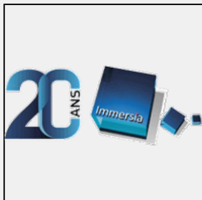
IMMERSIA, la plateforme de réalité virtuelle fête ses 20 ans