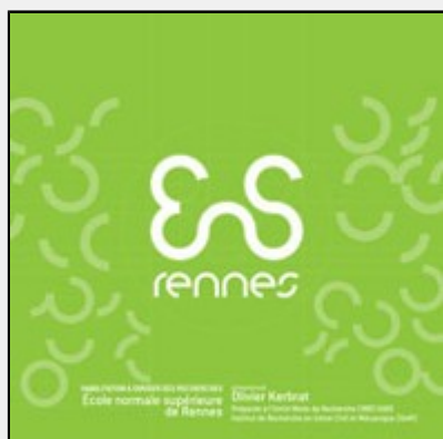
Performance des procédés pour une fabrication innovante et durable