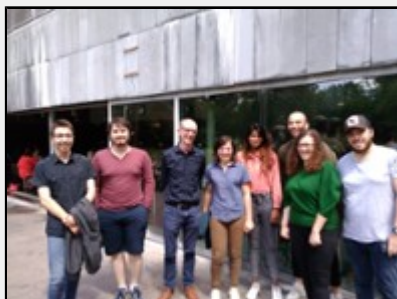
ENS Rennes students at UCC Cork Irlande