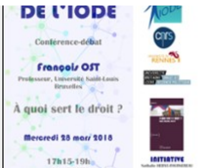
Les Rencontres de l'IODE "À quoi sert le droit ?"