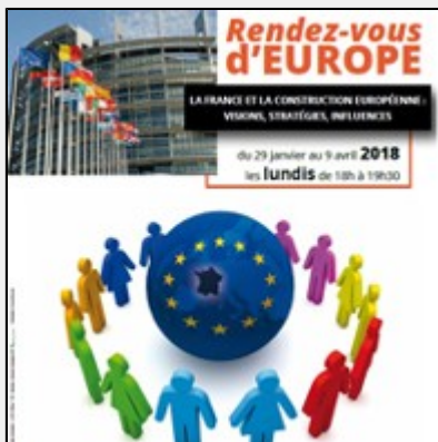
Rendez-vous d'Europe 2018