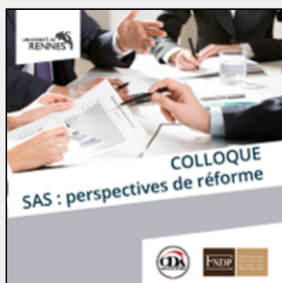
Colloque | SAS : perspectives de réforme