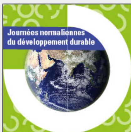
Journées normaliennes du développement durable - JNDD 2019-2020