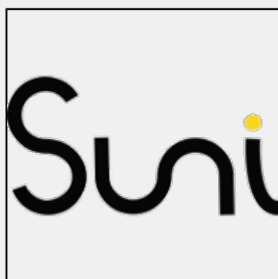
Inauguration de Suni