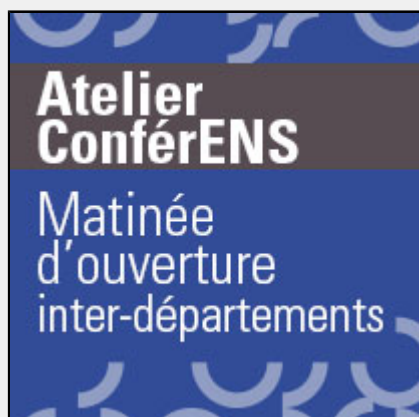
Atelier ConférENS : "Intégrité scientifique"