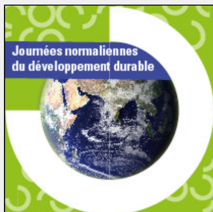
Journées normaliennes du développement durable - JNDD 2019-2020