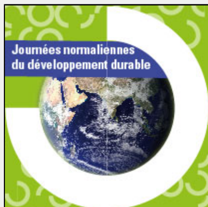
Journées normaliennes du développement durable - JNDD 2019-2020