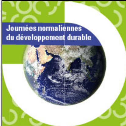
Journées normaliennes du développement durable - JNDD 2019-2020