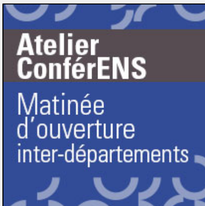
Atelier ConférENS : "Intégrité scientifique"