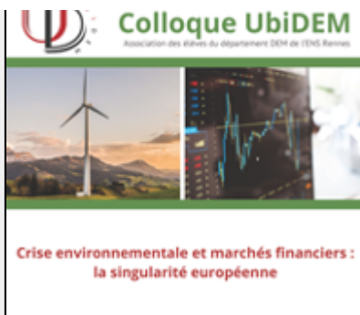
Colloque UbiDEM : "Crise environnementale et marchés financiers : la singularité européenne"