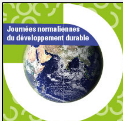
Journées normaliennes du développement durable - JNDD 2019-2020